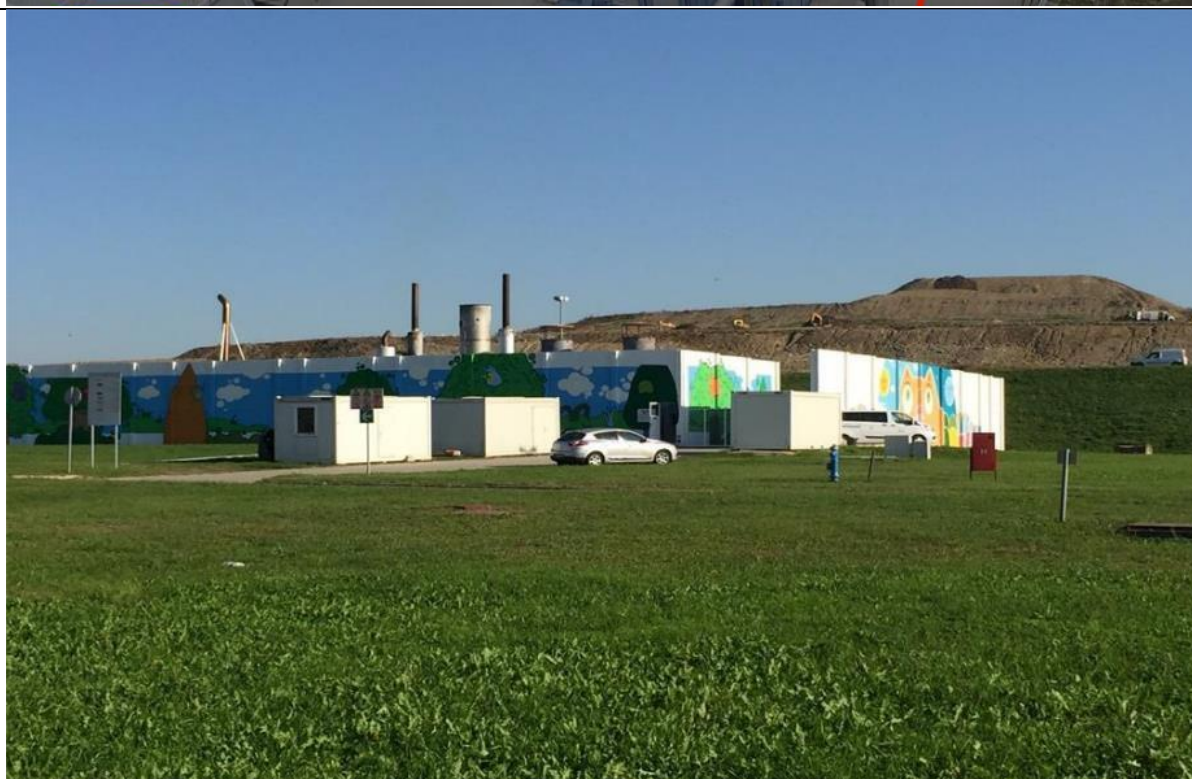
Slika 1. Plinsko postrojenje