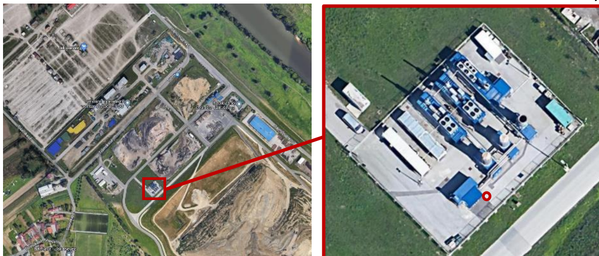
Slika 2. Mjerno mjesto na Odlagalištu otpada Jakuševci